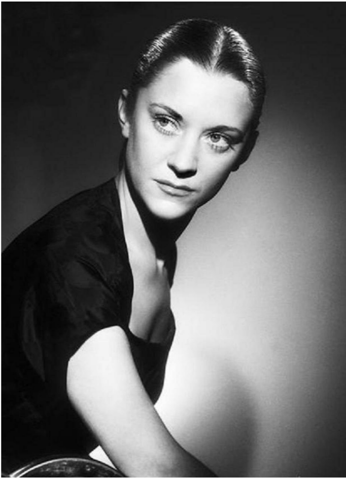
María Casares no asistió al sepelio de su amante, de su amigo, de su compañero y confesor. María Casares no acudió a la última cita con el amor de su vida. Y lo hizo con la misma determinación con la que jamás regresó del exilio a su tierra natal.

Sacarle jugo a la filmación sería ya harina de otro costal, dado que podía salir rana por variados percances técnicos. Y a todo esto, habría que añadir las dificultades que siempre mostraban las administraciones a la hora de permitir la proyección de las imágenes en espacios públicos. Sin duda, aquello se debía a la entusiasta afición que poseían los químicos del celuloide de la época a la hora de provocar ostentosos incendios en plena función, lo que siempre conllevaba altercados e histerias varias.