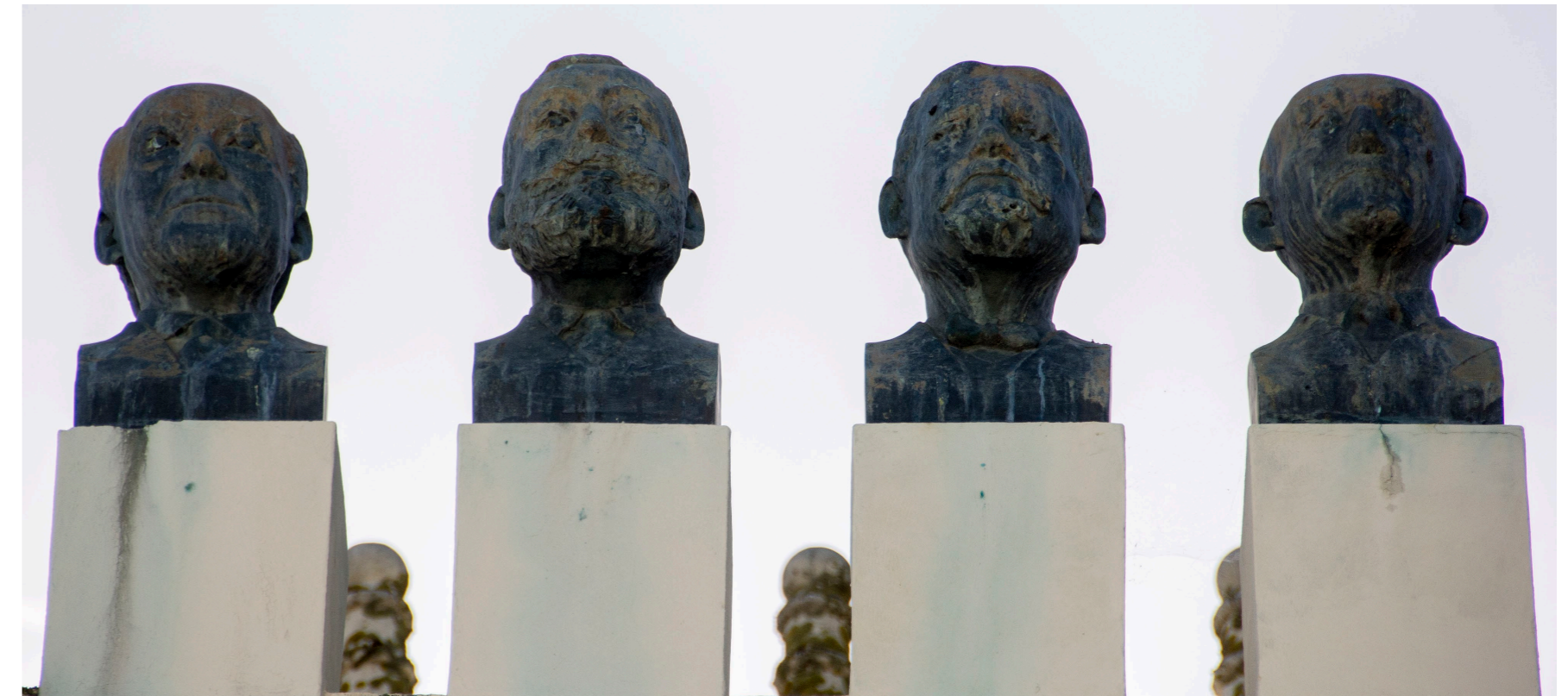
Os bustos de Wenceslao Fernández Flórez, Manuel Murguía, Pérez Lugín e Julio Camba

Emilia Pardo Bazán, a única muller do grupo, mira cara os xardíns xunto a Vilar Ponte, Salvador de Madariaga e Juan Fernández Latorre, mentres que Wenceslao Fernández Flórez, Murguía, Pérez Lugín e Julio Camba miran cara o Kiosco Alfonso