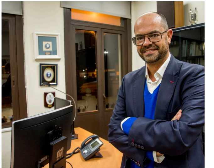
A Terraza acolle a cabeceira territorial de RNE e a delegación de TVE

Administración no que non só estean os partidos políticos, tamén todos os estamentos da sociedade. O modelo da corporación debe asemellarse ao da televisión pública alemá, onde no Consello de Administración hai sesenta voces e onde os partidos apenas teñen poder porque, ao seu carón, hai representantes de toda a cidadanía, desde o ámbito universitario até o sindical ou relixioso. Con tanta ida e volta, é complicado que a cidadanía confíe na corporación como un servizo público neutral e rigoroso. Ao final, damos a imaxe de ser o xoguete do partido político de turno que estea no goberno e iso prexudícanos moitísimo porque, ao final, perdes público. Sen público non existe o servizo público. Temos profesionais moi preparados e moi independentes e é unha mágoa que os políticos non o queiran fomentar.